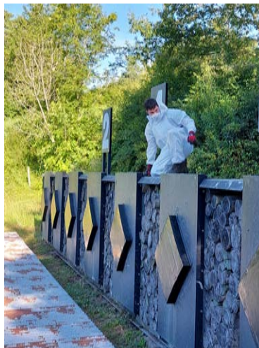
Deckel wieder montieren.