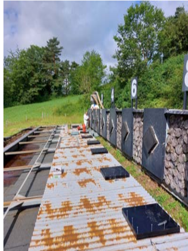
Der Bleistaub im Granulat wird durch eine Zentrifuge entfernt, danach wird das saubere Granulat wieder eingefüllt.