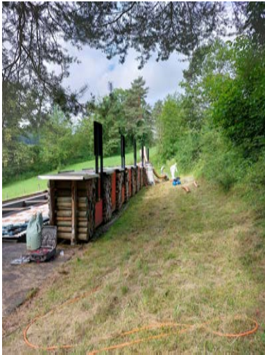
Material ausladen und einrichten.