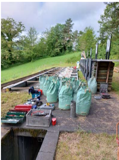
Das Granulat von Scheibe 1 ist in den Säcken und kommt am Schluss in Scheibe 10.