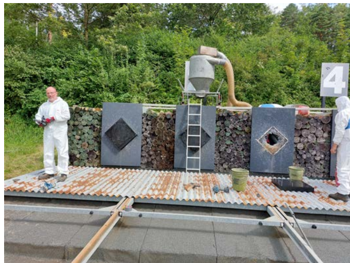
Wenn das Granulat umgefüllt ist, werden die Zentralkappen entfernt und durch neue ersetzt.